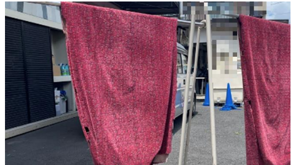
丁寧にクリーニング(漬け込み洗い→手洗い→タンブラー※による仕上げ洗い→脱水→乾燥) ※洗濯槽