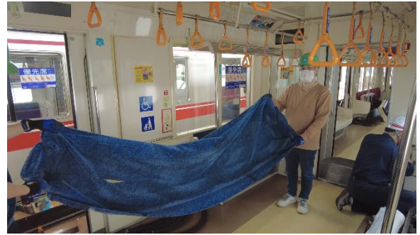
車両基地にて、引退する車両から座席シート生地を採取