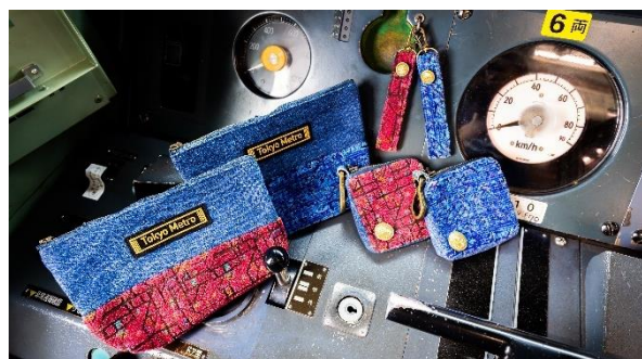
「新たな価値」をもったアップサイクル商品に再生！