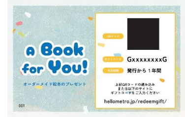
ギフトカード イメージ