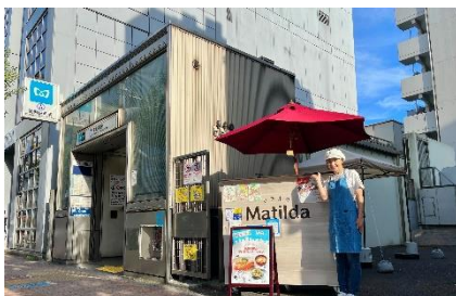
東京メトロ沿線へのテイクアウトステーション設置 (株)マチルダ