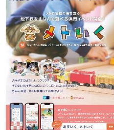
「地下鉄」を素材に学んで遊べる一時保育イベント「メトいく」 (株)grow&partners、(株)OWLedg