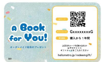
ギフトカード イメージ