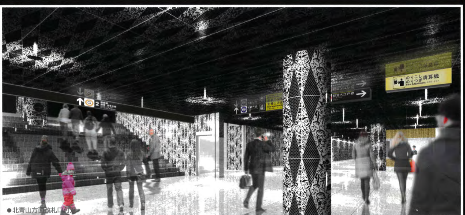
●北青山方面改札口付近