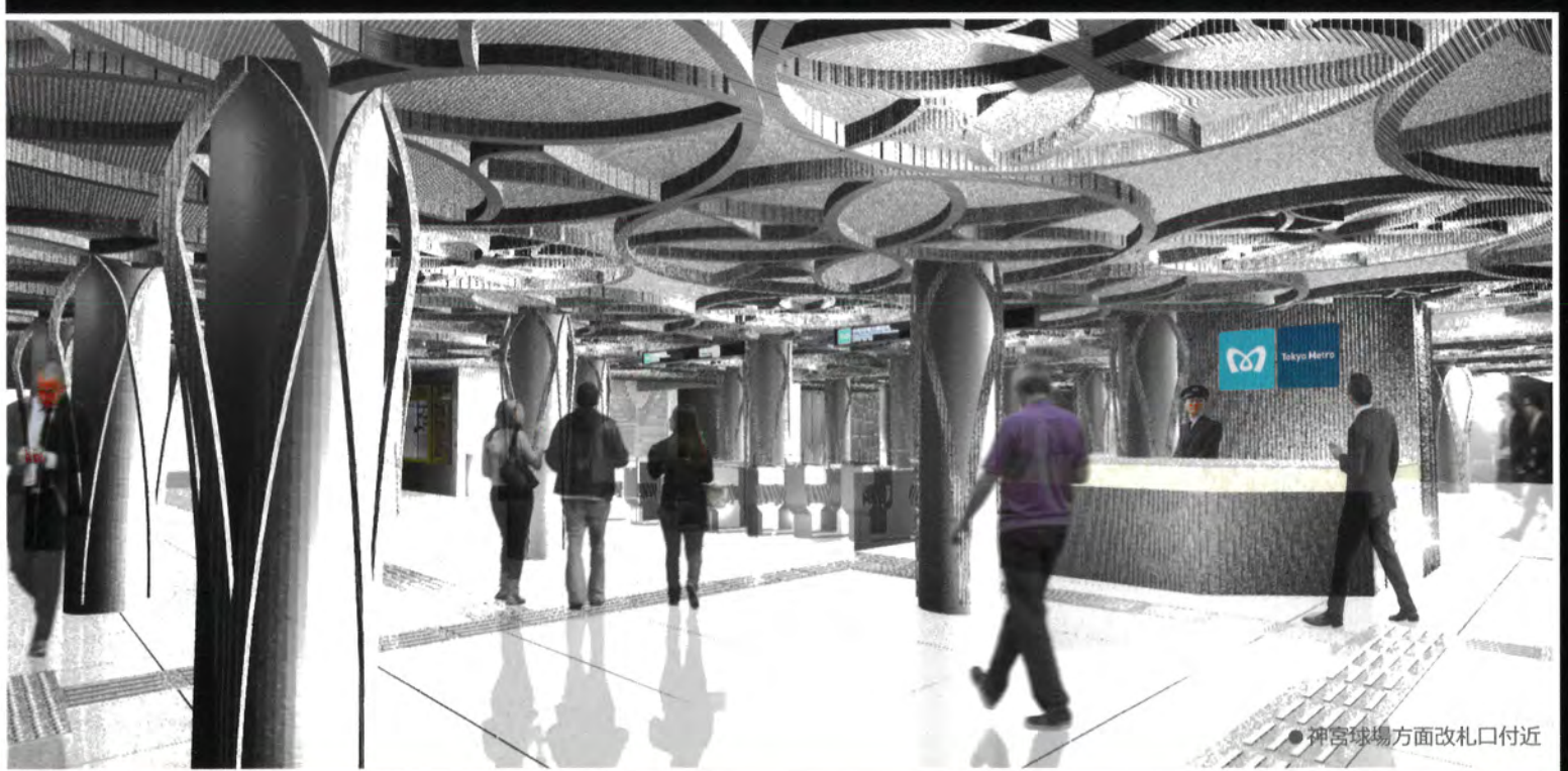
●神宮球場方面改札口付近