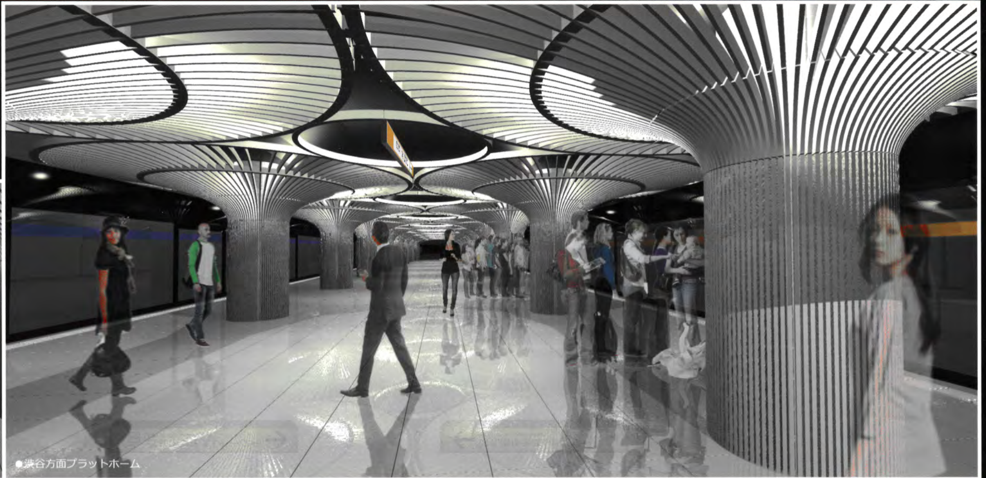
●渋谷方面プラットフォーム