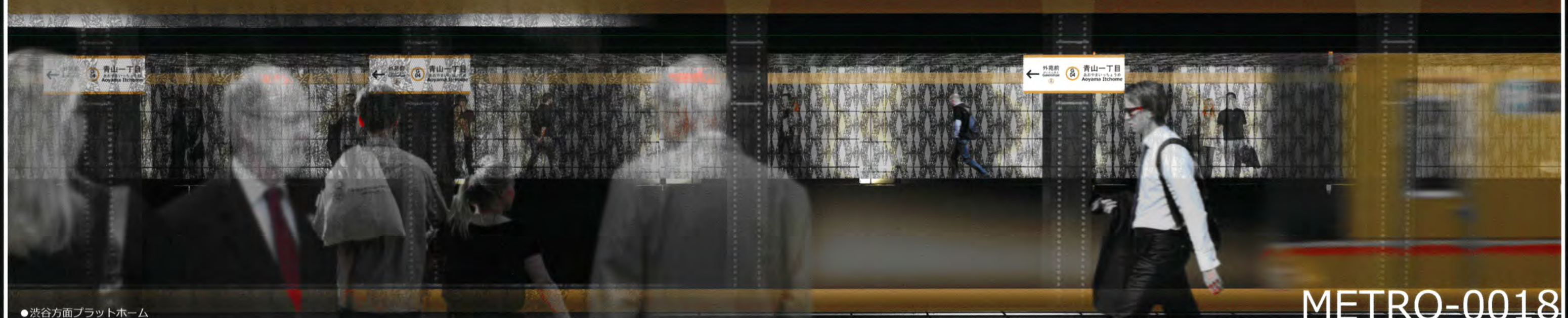
●渋谷方面プラットフォーム METRO-0018