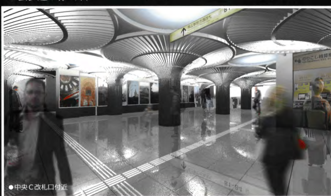
●中央C改札口付近 ●渋谷方面プラットフォーム